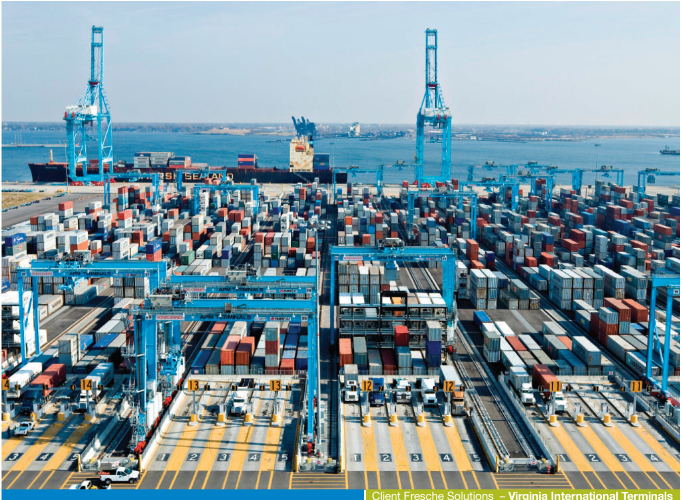
Client Fresche Solutions – Virginia International Terminals

Apprenez à connaître votre portefeuille d'applications et à tracer une nouvelle voie pour votre entreprise.